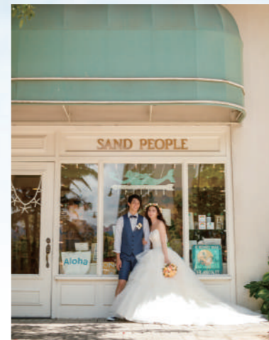
挙式前ワイキキタウンフォト [NF-21] ドレス&タキシードで、レストランやセレクトショップが軒を連ねるワイキキタウン。そこで撮る写真はまるで映画のワンシーン! 挙式前の写真も撮れます。