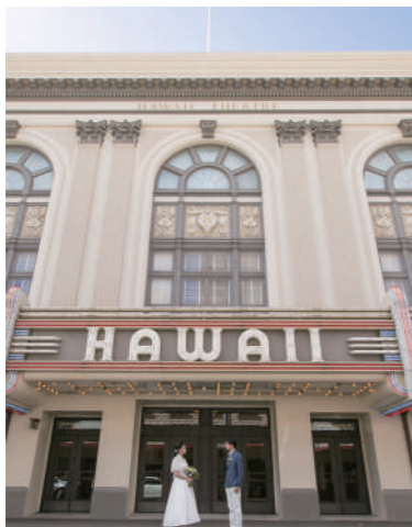
ハワイシアター [NF-20・31] 「Pride of the Pacific」と呼ばれる美しいハワイシアター (映画館) をバックにした撮影は、映画のワンシーンみたいで記念に残したい1枚です。