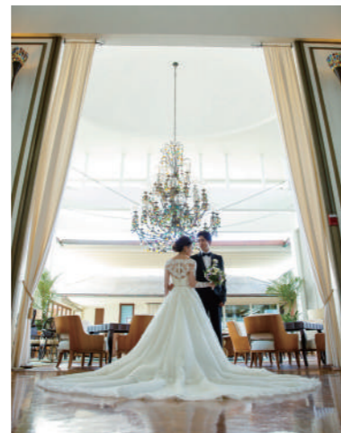
ホテル内 [NF-8] ハワイには、絵になるロケーションのホテルがたくさん。そんなホテルでオシャレな撮影を! 写真のホテルは眩いばかりの白砂のビーチに囲まれ、幻想的な雰囲気を醸し出す「カハラホテル」。