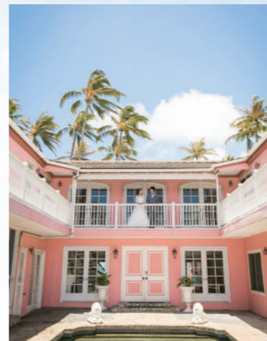
ダビングハウス邸宅 & ビーチフォト [NF-30] レトロな雰囲気のピンクのビーチハウス。シャンデリアや螺旋階段、ピンクのインテリアなど、すべてがフォトジェニック。邸宅前でビーチフォトも撮影できます。