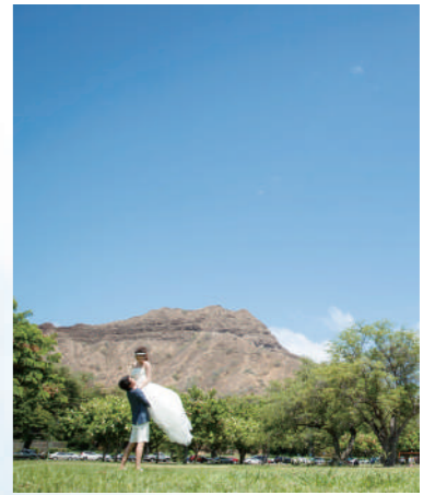
カピオラニ公園 [NF-29] ダイヤモンドヘッドのふもとにある緑豊かな公園。童話に出てくるような大木のそばで、まるで森の中のような海外ならではの写真が撮れます。壮大な広さも魅力です。