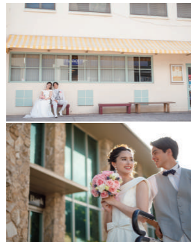
カイクイタウンフォト [NF-28] ローカル感たっぷりのカイクイタウン。タウンフォトは、お店の前や道路を渡るシーンなど、その一瞬一瞬をカメラマンと一緒に歩きながら撮影ができるのが魅力です。