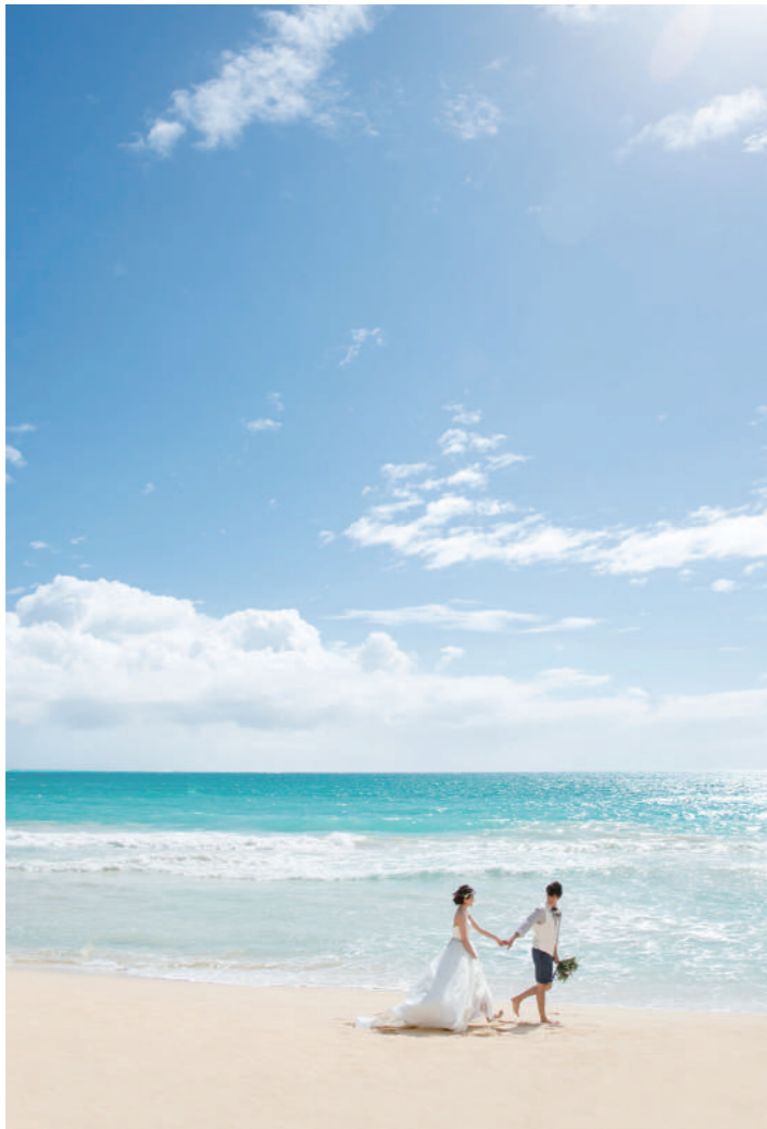
ワイマナロビーチ (ビーチ指定) [NF-12] コオラウ山脈の切り立った崖をバックに、真っ白に続く美しい砂浜のビーチ。穴場スポットなので人が少なく静かで、近くに公園もあり自然に満たされ癒されることでしょう。