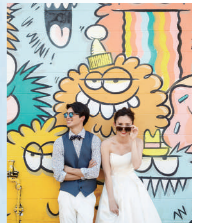
カカアコタウン [NF-35] ハワイ屈指の芸術街。立ち並ぶビルや倉庫にウォールアートが描かれ、まるで街全体がフォトスタジオのような気分になります。ゆっくりと歩きながら、アートに溶け込んで特別なウエディングフォトを残せます。