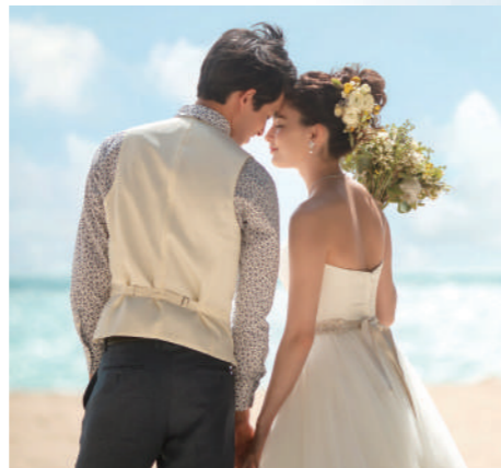
ケイキビーチ (ビーチ指定) [NF-23] ハワイ北海岸に位置し、夏は穏やかに波に運ばれた美しい貝やサンゴの欠片がたくさんあり楽しめます。冬は押し寄せる波をバックに迫力ある写真を撮ることが出来ます。