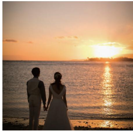
サンセットビーチ [NF-10] 世界一美しいと言われるハワイのサンセットの中でロマンチックな撮影。幻想的な雰囲気の中、ドラマチックな写真が残せます。